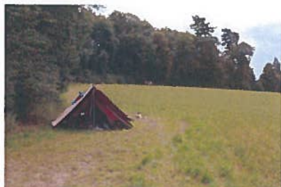
Pfadilager im Juli 2017 in Greng

Zur Aktion „GrenG in aller Welt“ sind diesmal keine Fotos zur Publikation im Info-Bulletin eingegangen. Die Gemeindeverwaltung nimmt gerne weiterhin Fotos mit unserer Gemeindefahne entgegen. Diese Aktion wurde an der Gemeindeversammlung vom Mai 2010 ins Leben gerufen. Ziel dabei ist, unser Gemeindepappen in aller Welt zu zeigen.